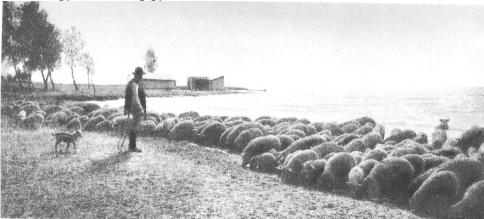
Itat a kanász a Balatonból

Ha a munkájával elégedettek voltak, akkor a gazdaasszony az év utolsó napján rétest süt, és jól tartja a kanászt, így engedi haza, a kialakított bérével együtt. Általában 14-15 éves koráig kanász a gyerek, addig gyerekszámba veszik.