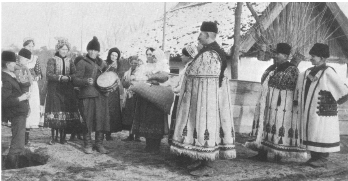
A kisbíró és hallgatósága